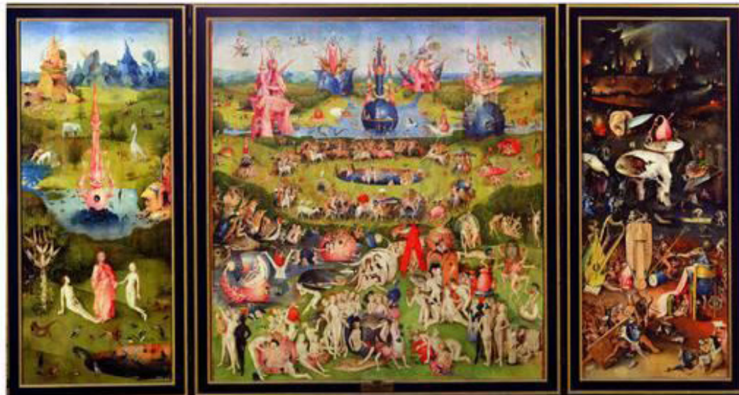
Garden of Earthly Delights - Hieronymus Bosch