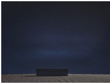
Lada i månljus

5 500 :- Analogt fotografi, 2014 C-print, 40x53 cm 1/3 ex.