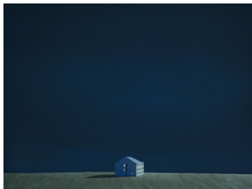
Det övergivna huset

5 500 :- Analogt fotografi 2015 C-print, 40x53 cm 1/3 ex.