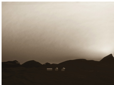
Den glömda byn

5 500 :- Analogt fotografi 2105 C-print, 40x53 cm 1/3 ex.